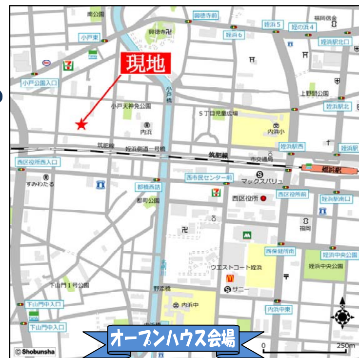
※当日はこの地図を参考にお越しください。