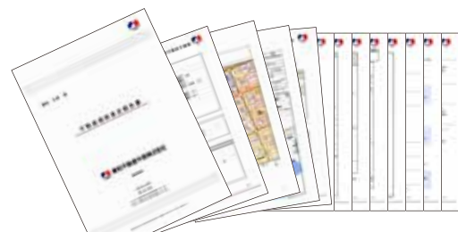
積和不動産中国オリジナル査定報告書

もちろんです。専門スタッフが、右にある オリジナル査定書 に基づき、しっかり査定いたします。土地の種類、建物の種類(宅地・一戸建・マンション・アパート・店舗・農地など)は問いません。もちろん査定無料、秘密厳守ですのでご安心ください。